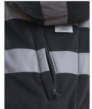
Bolsillo con cremallera