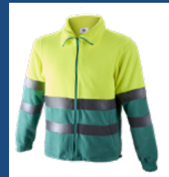
111 Verde claro/Amarillo AV DESCATALOGADO (últimas unidades)