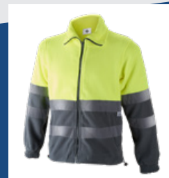
051 Gris/Amarillo AV