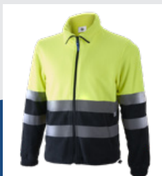
031 Marino/Amarillo AV