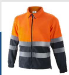
032 Marino/Naranja AV