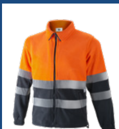
052 Gris/Naranja AV