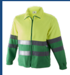
101 Verde medio/Amarillo AV DESCATALOGADO (últimas unidades)