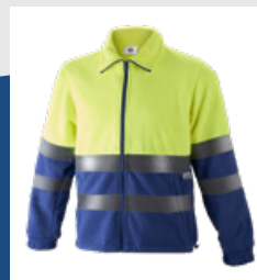
041 Azulina/Amarillo AV DESCATALOGADO (últimas unidades)