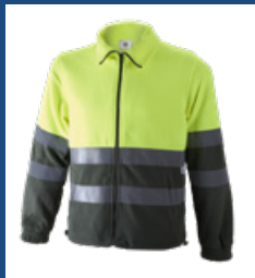
091 Verde oscuro/Amarillo AV DESCATALOGADO (últimas unidades)