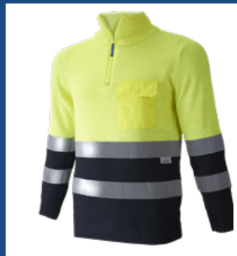
031 Marino/Amarillo AV