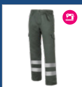
009 Verde oscuro