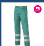
011 Verde claro