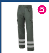
009 Verde oscuro