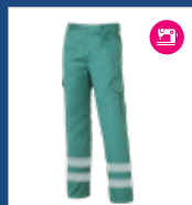
011 Verde claro