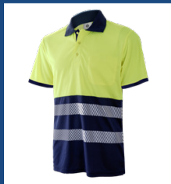
031 Marino/Amarillo AV