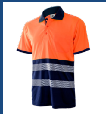
032 Marino/Naranja AV