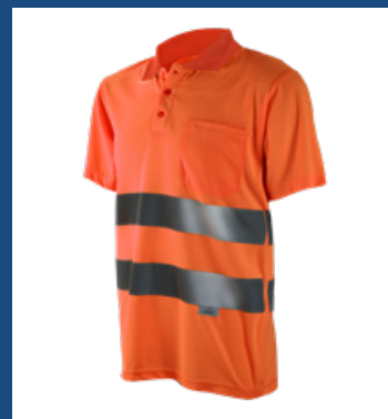
002 Naranja AV