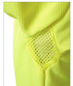
Detalle de las axilas