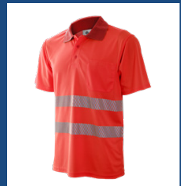
020 Rojo AV