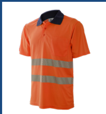
002 Naranja AV