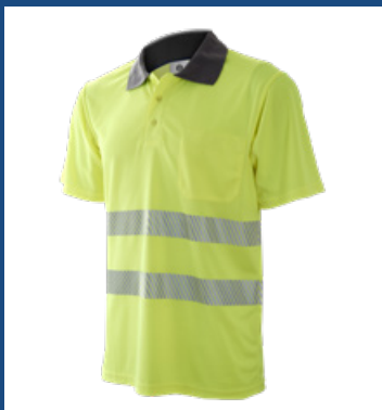
001 Amarillo AV