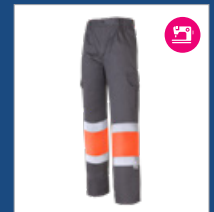
052 Gris/ Naranja AV