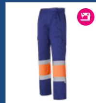
042 Azulina/ Naranja AV DESCATALOGADO (últimas unidades)