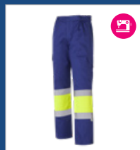
041 Azulina/ Amarillo AV