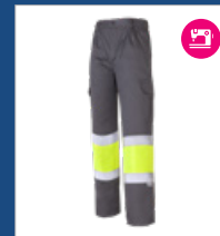
051 Gris/ Amarillo AV