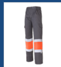
052 Gris/ Naranja AV