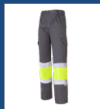
051 Gris/ Amarillo AV