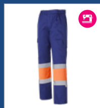
042 Azulina/ Naranja AV