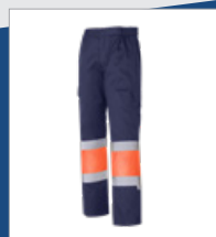
032 Marino/ Naranja AV