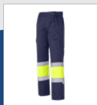
031 Marino/ Amarillo AV