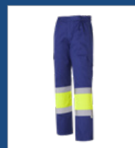
041 Azulina/ Amarillo AV