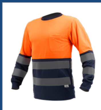
032 Marino/ Naranja AV