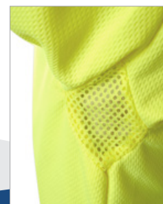
Detalle de las axilas