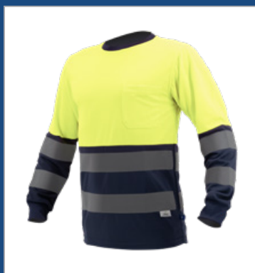
031 Marino/ Amarillo AV