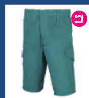
011 Verde claro