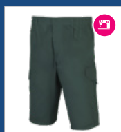
009 Verde oscuro