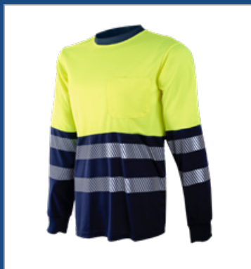
031 Marino/ Amarillo AV