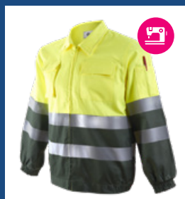
091 Verde oscuro/Amarillo AV DESCATALOGADO (últimas unidades)