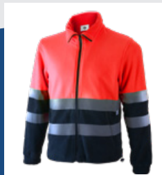
320 Marino/Rojo AV