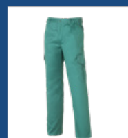
011 Verde claro