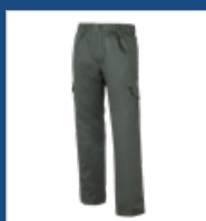
009 Verde oscuro