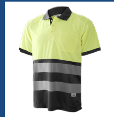
051 Gris/Amarillo AV