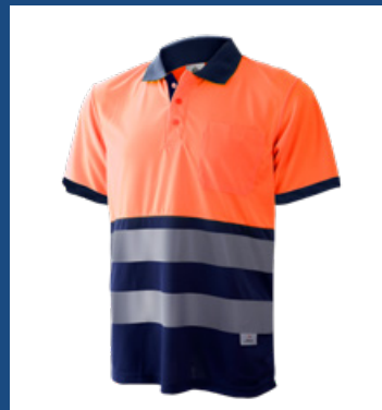
032 Marino/Naranja AV