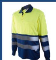
041 Azulina/ Amarillo AV