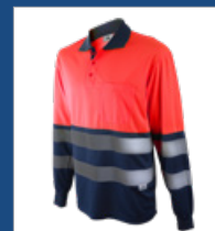
320 Marino/Rojo AV