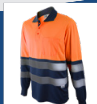
032 Marino/ Naranja AV