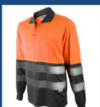
052 Gris/ Naranja AV