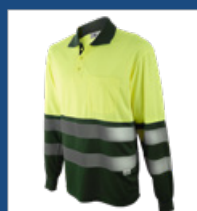
091 Verde oscuro/ Amarillo AV