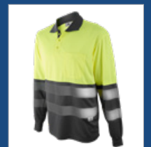
051 Gris/ Amarillo AV