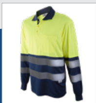
031 Marino/ Amarillo AV