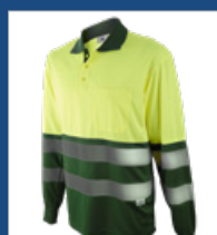
101 Verde medio/ Amarillo AV