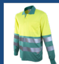
111 Verde claro/ Amarillo AV