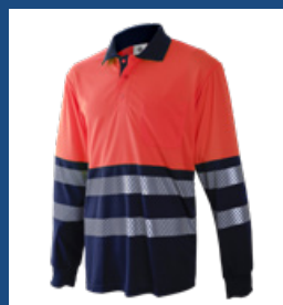
320 Marino/Rojo AV