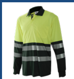
051 Verde oscuro/Amarillo AV