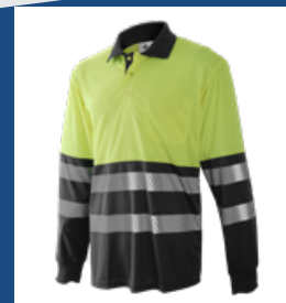
051 Gris/Amarillo AV