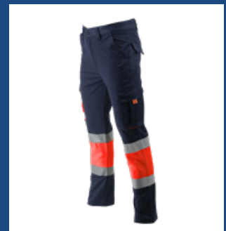
320 Marino/Rojo AV