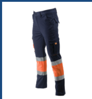
032 Marino/Naranja AV