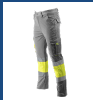
051 Gris/Amarillo AV