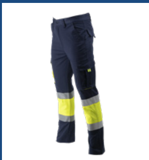
031 Marino/Amarillo AV